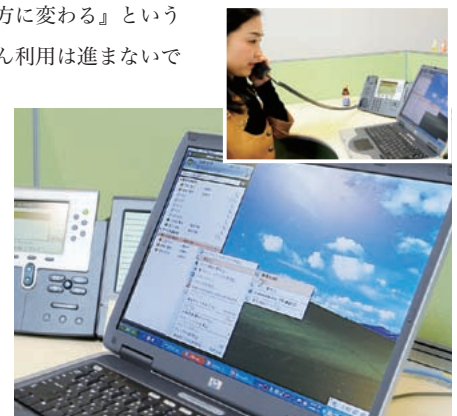
▲シスコユニファイド IP フォンと Microsoft Office Communicator 連携の利用イメージ

しょう。今回のトレーニングでは『他の人が電話に出てメモを書いたりする』ということは、その人の仕事を中断させてしまうことになる。だから、他の人に負担をかけないために、個人宛のボイス